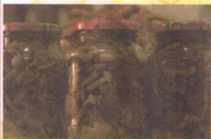
Аня Судакова, ученица 4 «б» класса

Готовим блюда из лесных даров мы самыми разными способами - варим, жарим, солим, консервируем и маринуем.